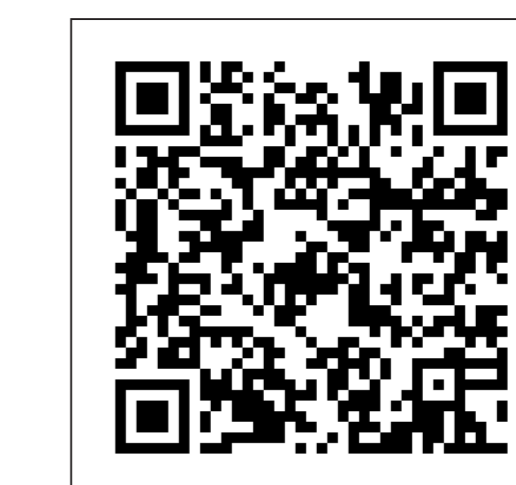
5. Khairi Jemli