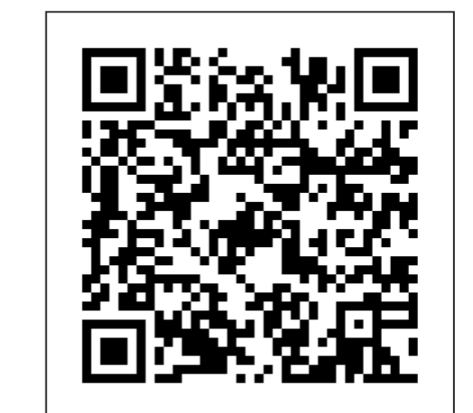
5. Khairi Jemli