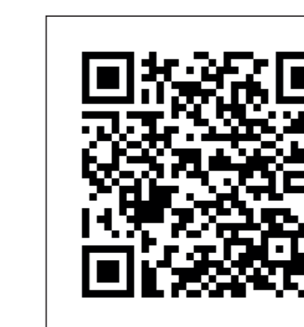
13. Cristóbal Barbero